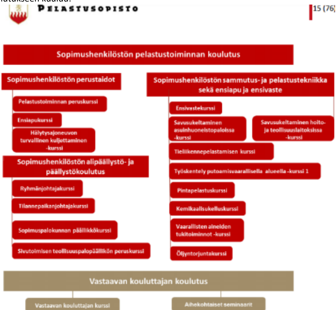
Kuva 1. Pelastusopiston sopimushenkilöstön koulutusjärjestelmä

Pelastusopiston opetussuunnitelman mukaisesti sopimushenkilöstön pelastustoiminnan koulutukseen kuuluu: